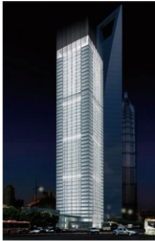
项目名称：21世纪大厦 地址：上海市 高度：236m