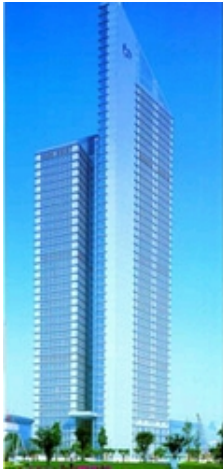
项目名称：交银金融大厦 地址：上海市 高度：265m